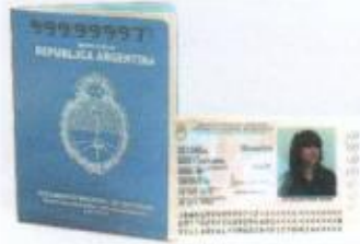
DNI LIBRETA CELESTE DIGITAL