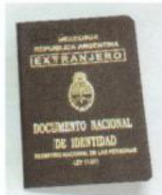
DNI BORDÓ MANUSCRITO