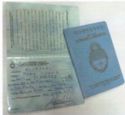
DNI CERO AÑO TAPA CELESTE CONFECCIÓN MANUAL (MANUSCRITO)