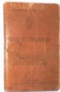
LIBRETA DE ENROLAMIENTO