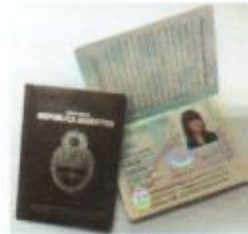
DNI LIBRETA BORDO DIGITAL

DNIS QUE PERDERÁN VALIDEZ A PARTIR DEL 1° DE ABRIL DE 2017: